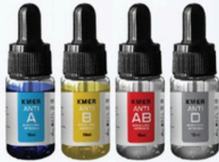
KMER Monoclonal Antibodies

Antisera yang dipakai untuk melakukan pemeriksaan golongan darah ABO dan Rh(D) pada manusia. Dengan prinsip Hemaglutinasi, antisera yang mengandung antibodi spesifik akan menyebabkan aglutinasi langsung pada sel darah merah yang mempunyai antigen sesuai dan dinyatakan positif. Tidak adanya aglutinasi umumnya menunjukkan tidak adanya antigen yang sesuai pada sel darah merah manusia dan dinyatakan negatif.