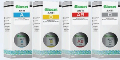
BIOSET Monoclonal Antibodies